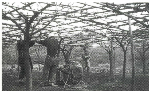
梨畑の消毒（昭和25年）