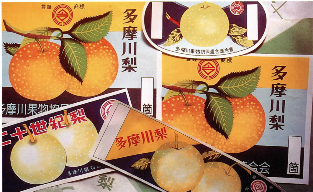
多摩川梨の出荷用ラベル

大正時代に入っても、梨の栽培面積は増え続けます。この時期には、梨の病虫害による被害も増えますが、東京府農事試験場による指導や生産者の努力により、梨の品質低下が食い止められます。大正8年(1919年)には、東長沼と矢野口の組合が合併して、稲城果実生産組合ができ、技術の向上、販路の拡大が進められました。大正時代中頃には富士川下流域の梨園の見学や梨の品評会、梨栽培の技術者を招いての講習会などが盛んに行われました。先進地の新しい技術が導入されたのもこの頃です。大正時代の末から出荷の容器が、竹かごから木箱に変わります。また昭和に入ると出荷方法が、これまでの荷車のほかに、小型トラックも利用されるようになります。