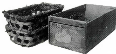
梨の出荷箱と梨かご

昭和7年10月3日付をもって公告された。かたかなのタマを中央に、そのまわりを漢字の川でかこんでいる。 『多摩川梨変遷史』より