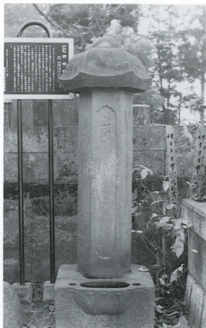
威光寺の庚申塔（稲城市指定文化財）

庚申信仰の本来の姿については、いくつかの考え方があります。人間の体内にいる三尺の虫が、庚申の夜に天にのぼってその人の罪過を天帝に告げるために命をちぢめられるとする中国の道教の教えに仏教的な信仰が加わったとする考えや、中国の道教思想以前からの日本固有の神道から始まったとする考えがあります。いずれにしても、庚申信仰は平安時代の頃には貴族社会で行われるようになり、鎌倉・室町時代には武家社会にも広まったようです。江戸時代になって各地の農村で信仰され、造塔が盛んになります。