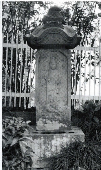
坂浜上谷の庚申塔