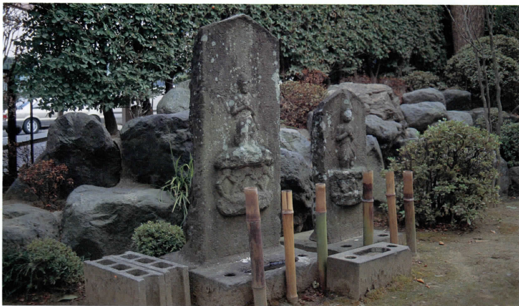
常楽寺境内の庚申塔

60日ごとにめぐってくる庚申（かのえさる）の日に、講中の人たちが当番の家に集まり、一定の儀式のあと夜を徹して飲食を共にし、夜明けと共に解散するというのが庚申講の一般的な形です。これは江戸時代以降に農村で流行した庶民信仰であり、講の継続を記念して、供養のために講中の人々によって庚申塔が造立されるようになります。