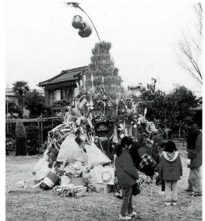
まわりに飾りものをつける(矢野口)