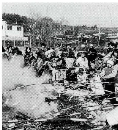
マユ玉団子を焼く(坂浜)