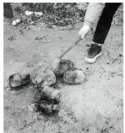
消火後にドウロクジンの石を取り出す(東長沼)