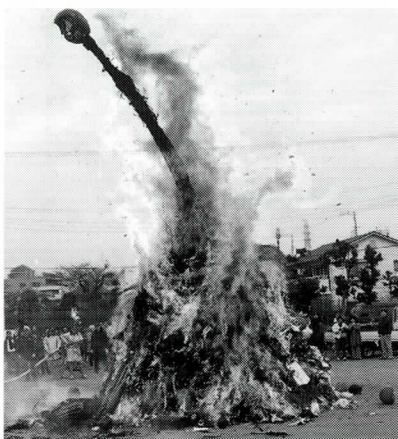
小屋を燃やす(東長沼)