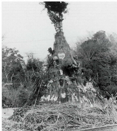
ワラなどで囲んで小屋をつくる(百村)