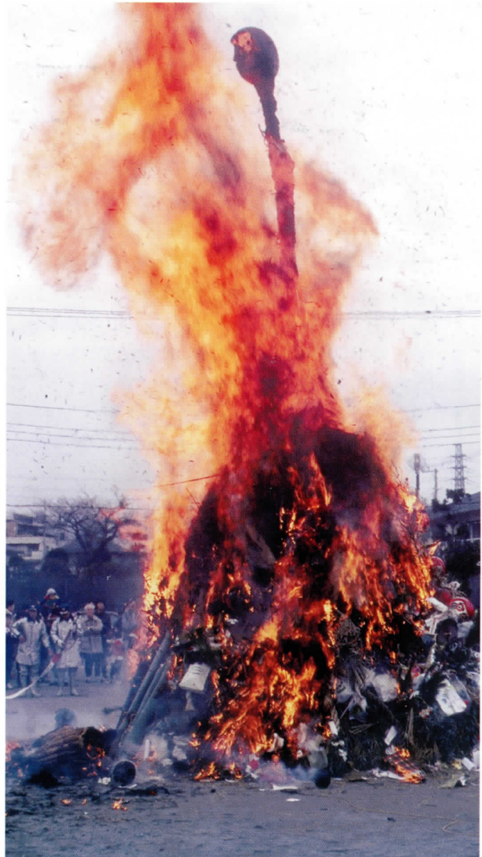
燃えあがる塞の神の小屋（東長沼）