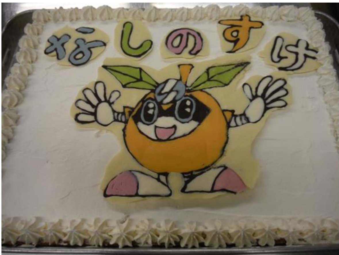
稲城市立第五保育園給食「なしのすけ お誕生日ケーキ」

バランスのとれた食事をおいしく・楽しく・感謝の気持ちで ～食卓に笑顔があふれるまち・いなぎ～