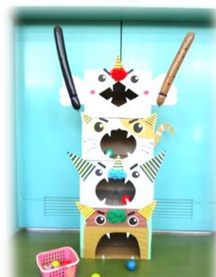
ボールを投げておに退治！