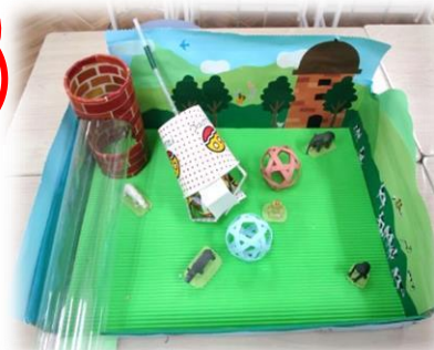
紙コップDEクレーンゲーム