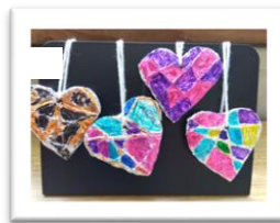
アルミホイルアート