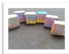
きらきらひかりのはこ