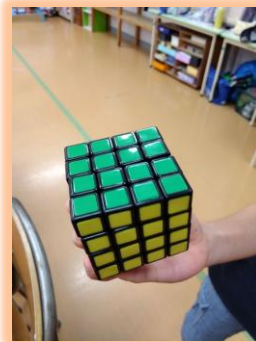
ルービックキューブ 上級者！