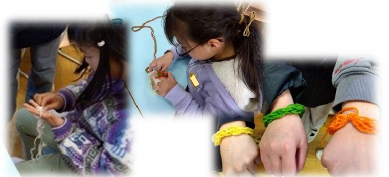
けいと 毛糸でブレスレット