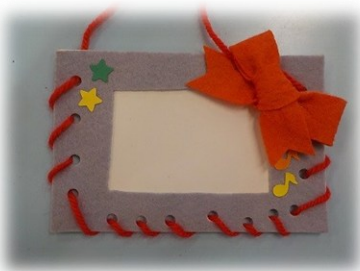
フェルトの写真入れ