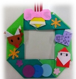
クリスマスリース