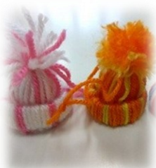
けいと ちい ぼうし 毛糸で小さな帽子