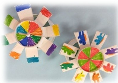
かみ 紙コップコマ