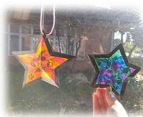
カラーセロファンで ステンドグラス