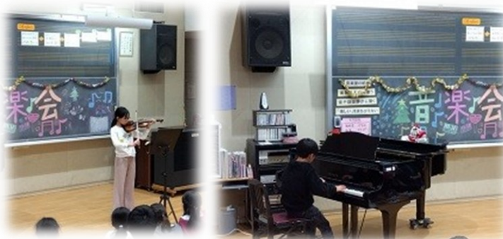
おながかい 音楽会♪