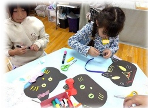
ハロウィン くろネコバッグ