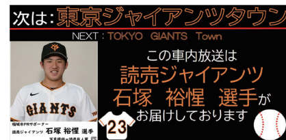
▲車内モニター表示イメージ