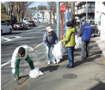
▲まちきれ実践行動の様子