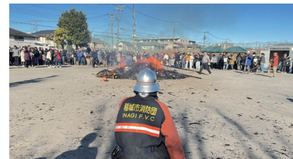
「#いいかも稲城」投稿写真