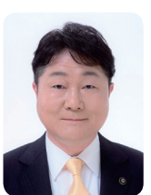
稲城市長 高橋 勝浩