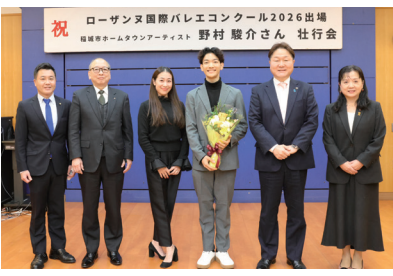
▲ローザンヌ国際バレエコンクール社行会の様子