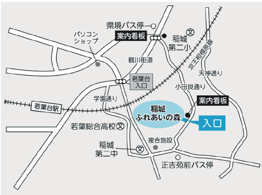
▲稲城ふれあいの森へのアクセス