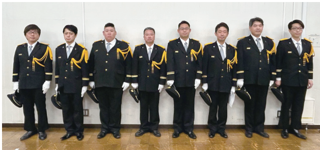
▲任命された各分団長