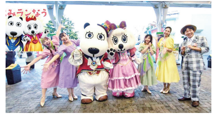
「#いいかも稲城」投稿写真

発行 稲城市 編集 秘書広報課広報広聴係 住所 〒206-8601 稲城市東長沼2111 電話 042-378-2111 FAX 042-377-4781 開庁時間 午前8時30分～午後5時