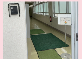
チャレンジクラス入口