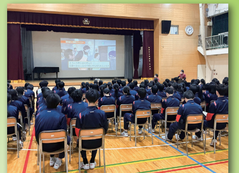
認知症サポーター養成講座の様子