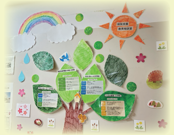
特別支援教育相談室前