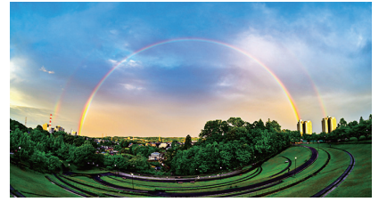
「#いいかも稲城」投稿写真

発行 稲城市 編集 秘書広報課広報広聴係 住所 〒206-8601 稲城市東長沼2111 電話 042-378-2111 FAX 042-377-4781 開庁時間 午前8時30分～午後5時