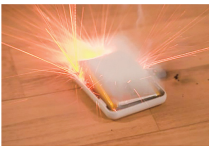
▲リチウムイオン電池による発火

リチウムイオン電池等の充電機、電気シェーバー・モバイルバッテリー等の充電機を取り外せない小型電子機器は、有害物として出すか、市内11カ所に設置している専用回収ボックスに出してください。誤って燃えないごみに混入すると、ごみ処理施設内で火災が発生する恐れがあります。