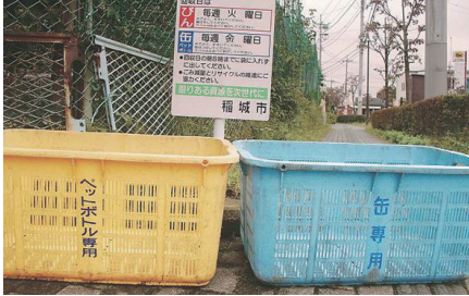
▲資源回収ステーション

台風や強風等の悪天候により、資源回収ステーションに設置したカゴが飛散する恐れがあります。回収を中止する場合があります。その際は、次の回収日まで自宅で保管してください。