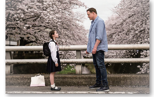
▲「レンタル・ファミリー」での1シーン(三沢川)