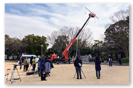
▲「君のクイズ」撮影風景(稲城中央公園)