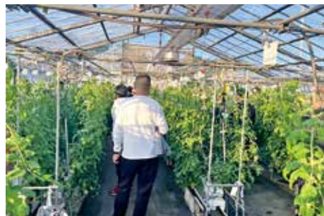
認定農業者視察研修