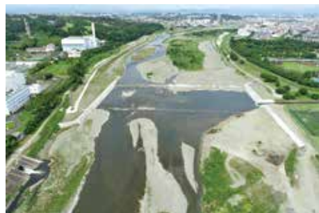
大丸用水取水施設