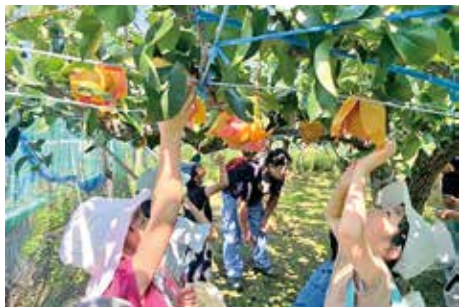
稲城第四小学校 梨のもぎ取り体験