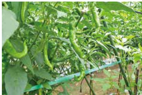
万願寺とうがらし