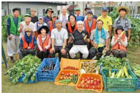
援農ボランティア 収穫祭