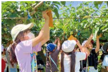
稲城第四小学校 梨の袋掛け体験