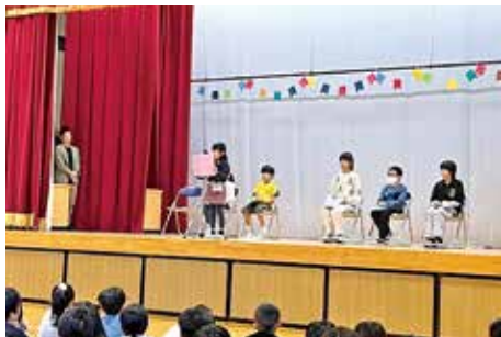
稲城第二小学校 稲作体験学習発表会