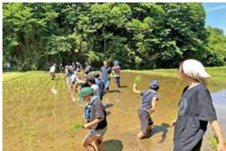
稲城第二小学校 田植え体験