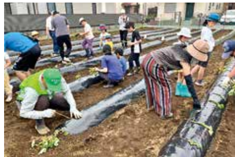
さつまいもの苗付け