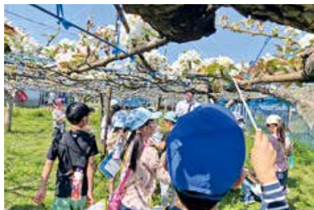
稲城第四小学校 梨の体験学習