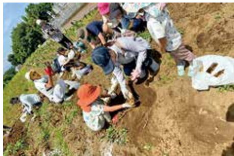
JA東京みなみ ジャガイモ掘り