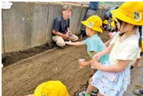
稲城第二小学校 初振り体験