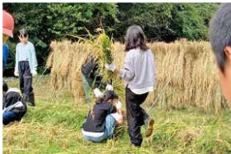
稲城第二小学校 稲の収穫