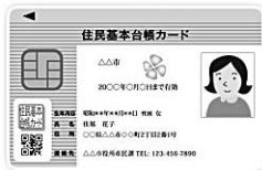
▲顔写真付き住基カードの例

住民票の写しや戸籍の各種届け出、証明書の申請時には、本人確認を行うことが法律で定められています。また、官公庁や金融機関でも不正な届