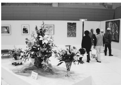
▲素晴らしい作品が数多く展示されます

今年も市民を中心に企画・運営し、5つの部門それぞれが多様な催しを行う「Iのまち いなぎ市民祭」を開催します。詳細や募集などは、随時広報いなぎでお知らせします。