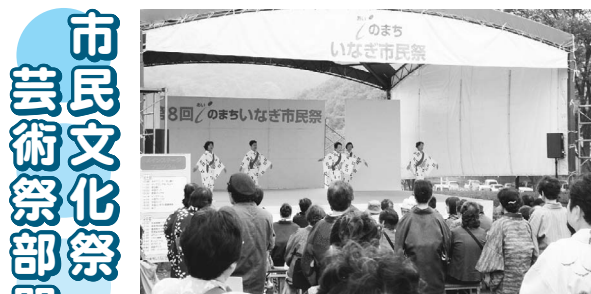
▲多彩なステージをご覧ください

21日(金)・23日(日) 市民文化祭・芸術祭部門 作品展示、お茶会 ※「市民文化祭ステージ部門」は11月3日(木・祝)・5日(土)・6日(日)に中央文化センターで、「俳句大会」は11月3日(木・祝)に、「囲碁大会」は11月6日(日)に地域振興プラザで行います。 問 生涯学習課社会教育係