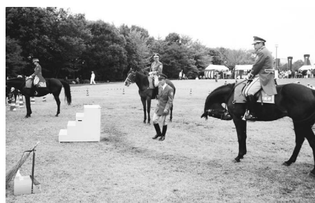
▲かわいい馬たちが待っています

22日(土)・23日(日) ファミリースポーツフェスタ部門 参加型サッカーイベント、グラウンドゴルフ、ターゲットバードゴルフ、いなぎあるくマップ紹介コーナー ※雨天となった場合には健康吹き矢を実施します。 問 体育課体育係