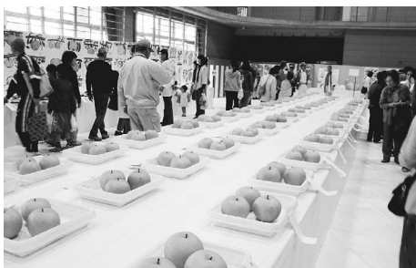
▲稲城の特産品を見にきてください

22日(土)・23日(日) 産業まつり部門 びつくり市、工業展(工業製品の展示・催し)、農産物・植木花卉品評会と直売、建設業PRコーナー、商店街紹介コーナー 問 経済課