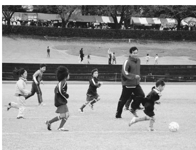
▲楽しく体を動かそう!

22日(土)・23日(日) ふれあいまつり部門 和太鼓コンテスト、フリーマーケット、子どもイベント、多彩なステージ 問 協働推進課協働推進係