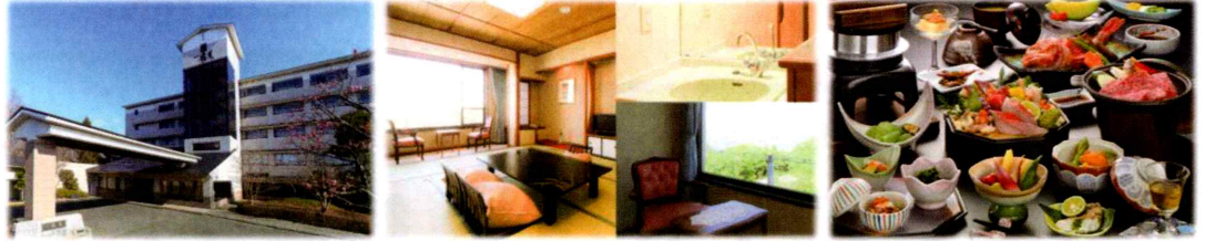
ホテル飛天ウェブサイトより (左：外観 中：和室 (例) 右：夕食 (イメージ))

日本百景の一つ、松川浦を望 む高台にあります。新鮮な海 の幸の料理と温泉を楽しめる 旅館です。