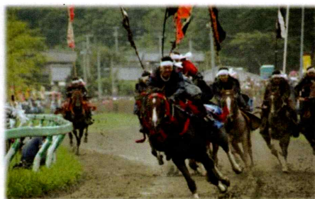
甲冑競馬 (写真提供：相馬野馬追執行委員会)