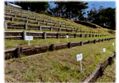
相馬野馬追 観覧用マス席

稲城市在住等一定の条件を満たす方は、本制度の利用で宿泊費の一部が助成 されます。この制度の利用を希望される方は、申込時にその旨を当社にお知 らせください。手続き等は追ってご案内いたします。令和8年度の制度の詳 細は4月1日以降、稲城市ホームページに掲載される予定です。