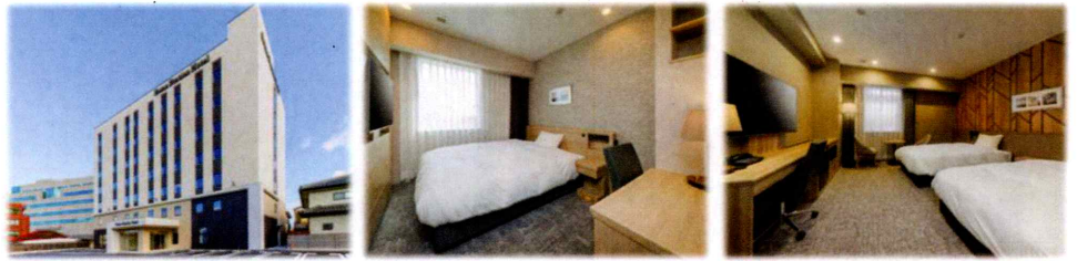
(左：外観 中：シングルルーム (例) 右：ツインルーム (例))

JR相馬駅徒歩2分と便利な場所にあり ます。2024年に改装されて快適に過 ごせます。