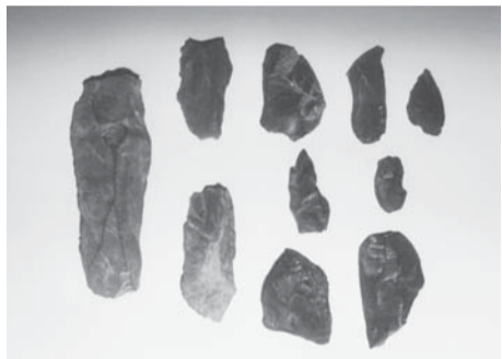
▲坂浜遺跡から発見された旧石器

どのような様子だったのでしょうか。市内からは、この時代に属する15カ所の遺跡が若葉台・長峰・向陽台・坂浜・平尾・百村・矢野口の丘陵地から発掘調査によって発見されています。これらの旧石器時代遺跡は、いずれも石器が数点出土しただけの小規模な遺跡ですが、発見された石器の形態から約1万3千年前から2万年前の時代の遺跡であることが判っています。石器を使って狩猟活動をしなから移動生活をしていたと考えられます。