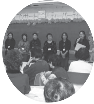
▲よんぶんおもしろサロン

年の瀬にくるみ大福を手作りしてお抹茶をたしなみ、幽玄の世界を体験してみませんか。幅広い世代の方のご参加お待ちしております。