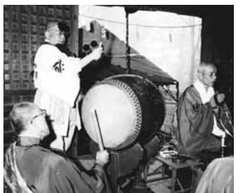
▲妙見尊の星まつり

城村のほかに、多摩地域の村々や神奈川、埼玉の村々の講中と230名を超す講員の名前が刻まれており、昔は大変な範囲な地域で信仰されていたことがわかります。戦前までの様子は、妙見尊の境内に多くの出店が並び、各地から訪れた講中の人々で賑わったといわれます。