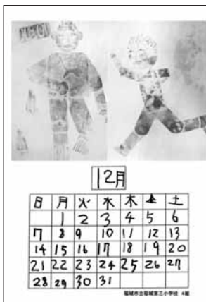
稲城市立稲城第三小学校4組の皆さんの作品です。

編集・発行 稲城市教育委員会教育部生涯学習課 〒206-8601 稲城市東長沼2111 ☎042-377-2121 042-379-0491