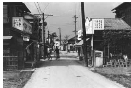
▲東長沼の町並み(昭和35年)