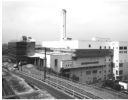
総合的なリサイクル施設を目指して

申し込み・問い合わせ Iのまちいなぎ市民祭実行委員会事務局(協働推進課協働推進係)