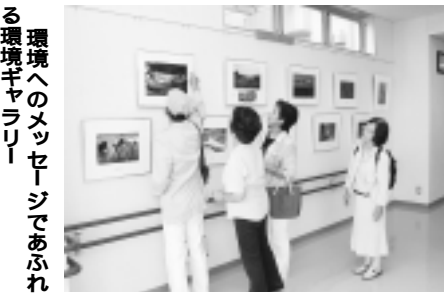
環境へのメッセージであふれる環境ギャラリー

クリーンセンター多摩川は、狛江市、稲城市、府中市、国立市の4市で構成する多摩川衛生組合が運営しています。収集されたごみを、より安全に効率よく処理するための清掃工場(ごみの中間処理施設)として、10年3月に完成しました。