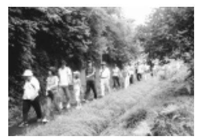
環境美化市民運動(7月23日) 各地区の自治会・管理組合が中心となって、市内一斉に清掃活動が行われ、1日でまちはすっかりきれいになりました。この運動は、自分たちの住むまちは自分たちの手できれいにしていこうと、昭和50年から始まりました。