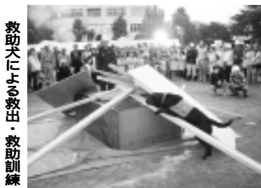
救助大による救出・救助訓練

いまだ地震が起きたら、あなたは落ちていて行動できませんか。被害を最小限に防ぐためには、日頃の災害に対する心構えや