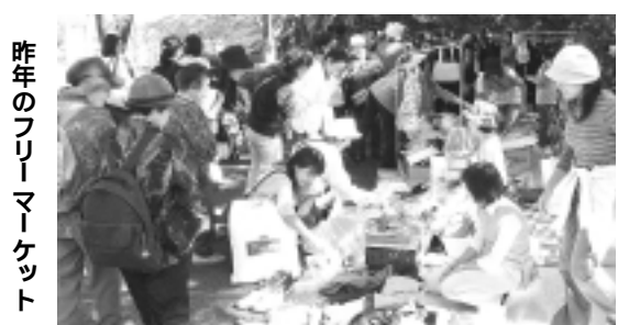
昨年のフリーマーケット

募集数 各日50区画(抽選) 区画規模 1・8m x 1・8m 費用 500円(1区画・1日) 応募方法 官製はがきに住所・氏名・電話番号・出店品目・出店希望日を記入し、郵送で応募してください。 1通につき1日とします(2日間希望する場合は、2通に分けてください)。 応募期限 9月20日消印有効 抽選・説明会 9月26日(火)午後7時から、地域振興プラザで行います。 出店を希望する方(代理可)は、必ず出席してください。