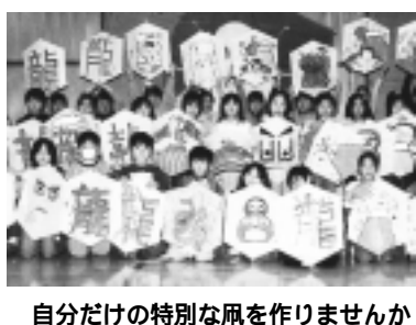
自分だけの特別な風を作りませんか