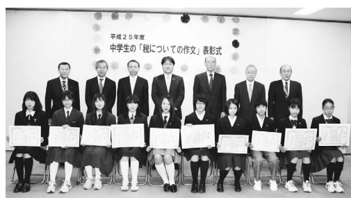
▲受賞者の皆さんほか

中学生の「税についての作文」優秀作品を表彰 11月28日、市役所において平成25年度中学生の「税について」の作文」表彰式が行われました。市内の6中学校から寄せられた657編の作文の中から10作品が入選されました(左表参照)。