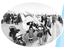
▲ゆるキャラさみっと in羽生の会場にて