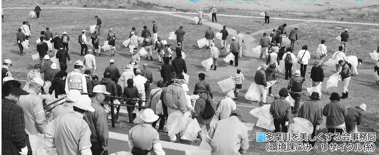
多摩川を美しくする会事務局(環境課ごみ・リサイクル係)