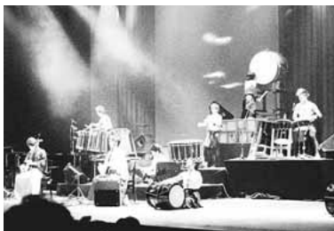
▲和楽器の魅力をお楽しみください

時 午後6時開演 場 iプラザ ホール 出演 M & Japan Orchestra (みちのく邦楽オーケストラ) 費 1,500円(前売・当日券とも)