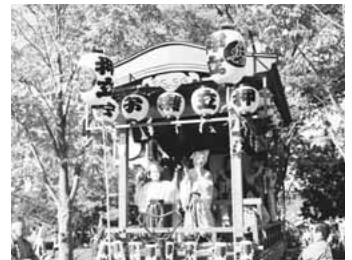
◀お囃子団体による演舞