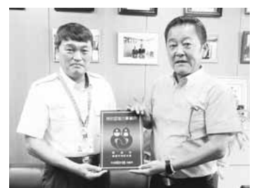
▲左から小泉消防長、奈良部商工会会長