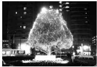
稲城駅南側ロータリーのクスノキ