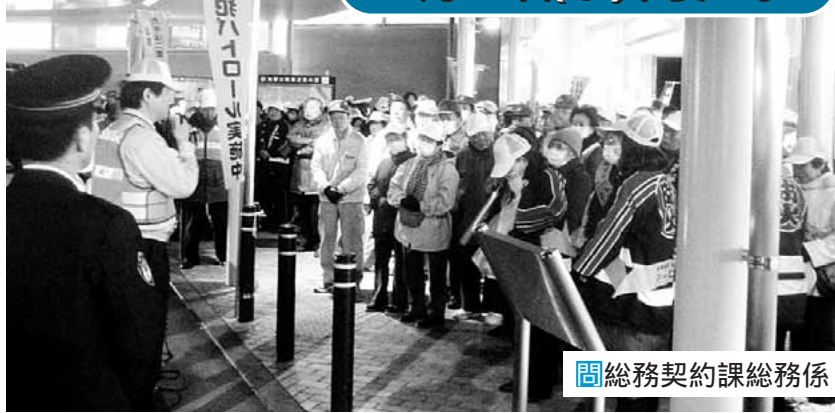
総務契約課総務係

年の瀬にかけ、様々な犯罪が多発するこの時期、稲城市安全・安心まちづくり推進協議会では、多摩中央警察署、防犯協会、自治会、防犯活動ボランティア団体などのご協力をいただき、安全で安心して暮らせるまちづくりを目指し、市内5カ所の会場を起点に「年末市内一斉防犯パトロール」を実施します。 12月17日(水) ※雨天中止 場時下図のとおり 稲城市安全・安心まちづくり推進協議会