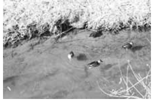
「三沢川のカモ」(稲城市フォトギャラリー投稿作品)