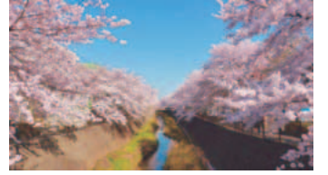
「三沢川の桜」 (稲城市フォトギャラリー投稿作品)