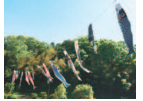
「鯉のぼり」 (稲城市フォトギャラリー投稿作品)