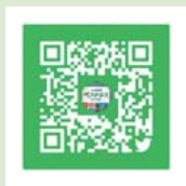
いなぎ発信基地 ペアテラス @pear_terrace