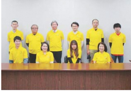
▲第29期稲城市青少年委員