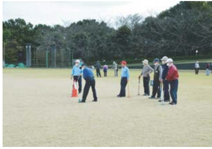
▲グラウンドゴルフ大会

みどりクラブは「友達が好き」「色々なことにチャレンジしたい」「生涯健康」等の思いで集まっているグループです。