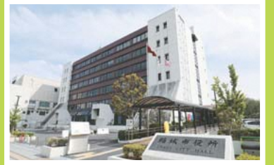
▲現在の市役所の庁舎(2021年)