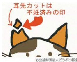
耳先カットは 不妊済みの印