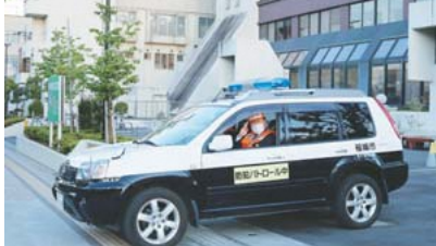
▲路上禁酒に対する巡回パトロールを行いました。