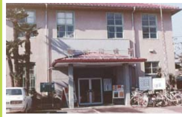
▲百村にあった市役所の旧庁舎(1974年)