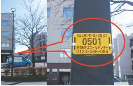
▲街路灯の管理番号

街路灯など 市では、夜間の通行に支障がないよう、街路灯などの夜間点検(灯具の損傷、故障などの維持・補修作業)を定期的に行っています。しかし、この点検だけでは