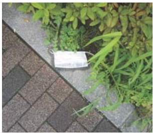
発見されたマスクのポイ捨て

コロナ禍で、マスクのポイ 捨てが増加しています。 「稲城市まちをきれいにす る市民条例」では、ごみのポ イ捨ては禁止されています。 まちの美化を損なうだけでな く、捨てられた不織布製マス クは、海洋ごみを増やす等、 環境汚染拡大の原因となりま