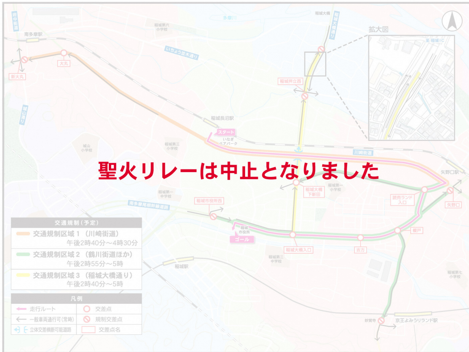
測量法に基づく国土地理院院長承認(使用)R2JH5 66-GISMAP44310号

当日は、走行ルート・ルート直近の道路で、長時間にわたり車両の通行が禁止されます。ルート周辺道路は混雑しますので、車でのお出かけはご遠慮ください。ご迷惑をおかけしますが、皆様のご理解とご協力をお願いします。