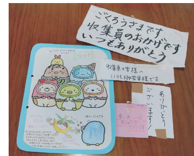
市民から寄せられた感謝の手紙（一部）

新型コロナの感染リスクがあり、また、ごみ収集量が増えている中、ごみ収集を継続して行っている収集作業員に対し、市民の皆さんから収集への感謝などを伝える手紙をいただき、収集作業員にとって大きな励みとなっています。