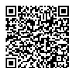
▲予約フォームはこちら