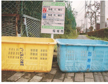
▲資源回収ステーション

なお、自宅で保管する際の負担を軽減し、回収日にペットボトルが飛散することを防止するために、ペットボトルはキャップとラベルを取り外して、潰して体積を減らして保管してください。