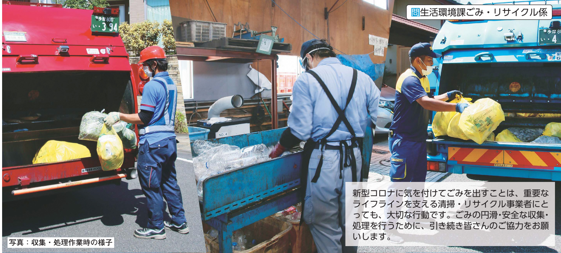
生活環境課ごみ・リサイクル係