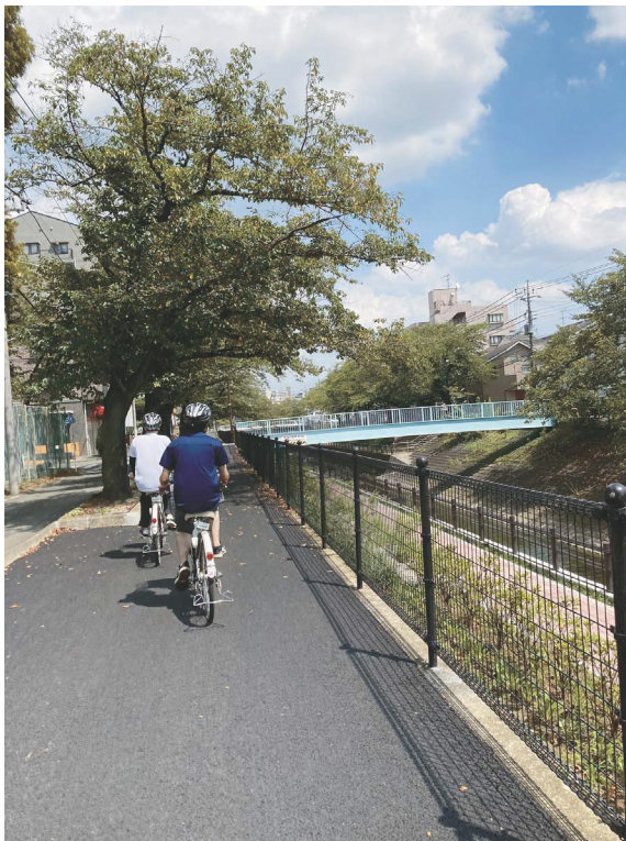
▲川沿いや紅葉スポットなどを走ります (一部、坂道もあります)。