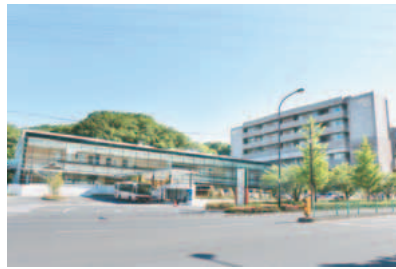
▲稲城市立病院（大丸1171）