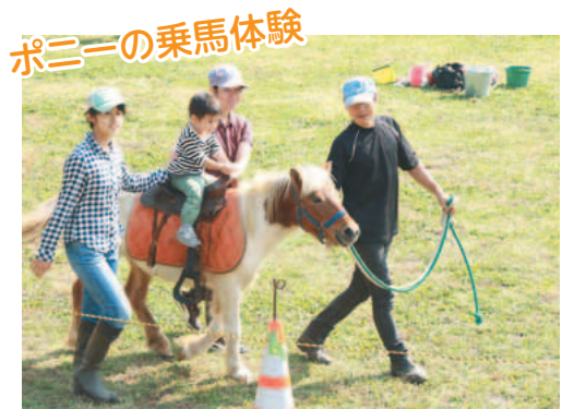
ポニーの乗馬体験