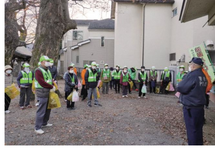
▲地域防犯パトロールの様子

市内には、現在37の自治会があります。自治会は、行政と連携して地域の課題を解決したり、災害など「もしも」に備えた活動を行う等、安全で安心、そして豊かなまちづくりを目指しています。