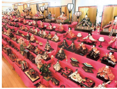
▲たくさんのひな人形を展示しています

子ども達の健やかな成長を願い、ひな人形を展示します。 日3月1日(火)～7日(月) 時午前10時～午後2時