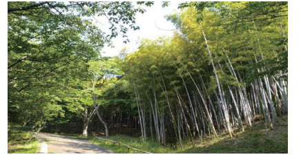
「#いいかも稲城」投稿写真

発行 東京都稲城市 編集 秘書広報課広報広聴係 住所 〒206-8601 稲城市東長沼2111 電話 042-378-2111 FAX 042-377-4781 開庁時間 午前8時30分～午後5時