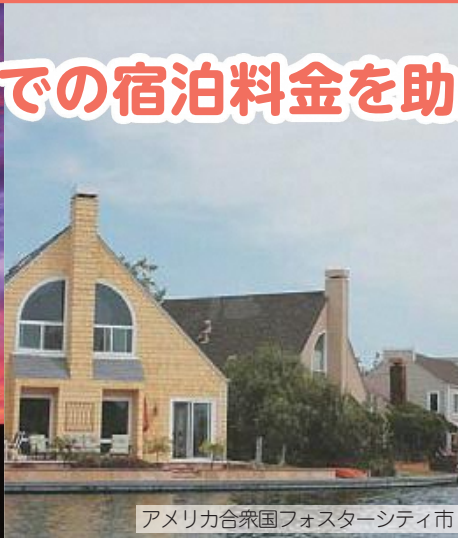
アメリカ合衆国フォスターシティ市