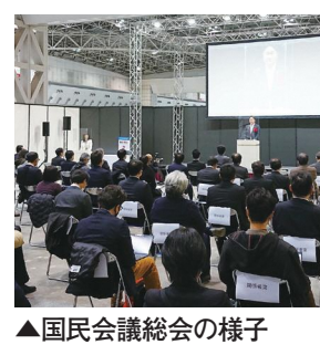
▲国民会議総会の様子

我々地方自治体は、インフラ整備の責任の一翼を担っており、しかし、これまで日々増加する一方の行政需要に比べ、インフラを新規増設することに精一杯で、メンテナンスまで手が回らないという実態もあります。さらに、高度経済成長期の終焉、バブル経済の崩壊、行政改革へと続く時代背景の中で、予算の制約、技術職員の不足、ノウハウ継承の困難など、大きな課題が起っています。