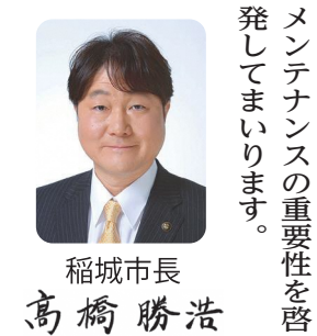
稲城市長 高橋 勝浩