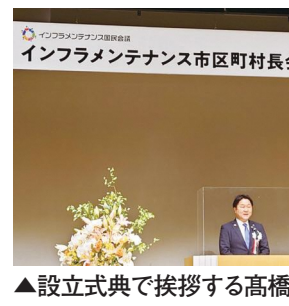
▲設立式典で挨拶する高橋市長