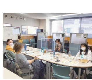
▲昨年度の実行委員会の様子

男女共同参画社会の実現に向け開催するフォーラムの実行委員を募集します。詳細は市民協働課等で配布しているチラシ、市HPをご覧ください。 市内在住・在勤・在学で女と男のフォーラムいなぎの企画・運営に関心がある方 ※託児有り(1歳以上の未就学児) ▽活動期間 5月(令和6年3月(1回)2時間程度、全10回程度、土・日曜日に活動予定)