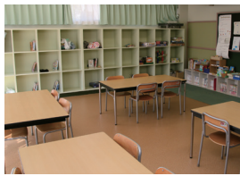
▲第三文化センター学童クラブ