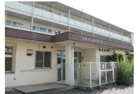
▲稲城市発達支援センター分室とする旧第四保育園