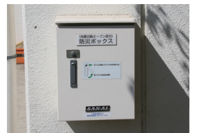
▲地震自動解錠ボックス