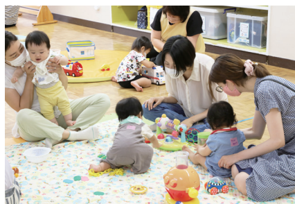
▲出張あそびの広場はぐはぐ

子育て情報の提供や親同士の交流、スタッフに子育て相談ができます。4月から第二文化センター児童館、第三文