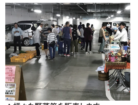
▲様々な野菜等を販売します

稲城市内の農家や商工会加盟店が集まり、新鮮な採れたて野菜や加工品等を販売します。 日時 4月9日(日)・23日(日) 時間 午前10時～11時(売り切れ次第終了) 場所 コーチャンフォー若葉台店地下駐車場(若葉台2-9-2) 問合せ 稲城市農業委員会(経済課農政係)