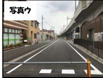
＜ペアテラス北側の現況＞

沿道の土地利用が進み、切下げなどの位置も定まってきたことから、車止めなどの安全施設を設置し、歩道を本整備する工事を今後予定しております。