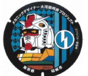
ガンダムの デザイン マンホール蓋