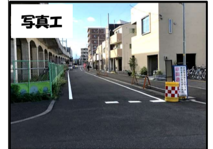
＜市役所通り側の現況＞