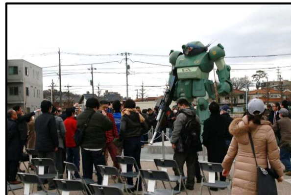
「スコープドッグ」モニュメント 除幕・お披露目式の様子

また、「いなぎペアパーク」横の歩道には、市内の回遊性を向上させ、観光客誘致の促進及び地域活性化を図ることを目的として、ガンダムのデザインマンホール蓋が設置されました。