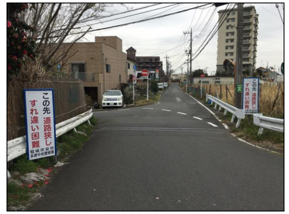
看板の新設及び整理