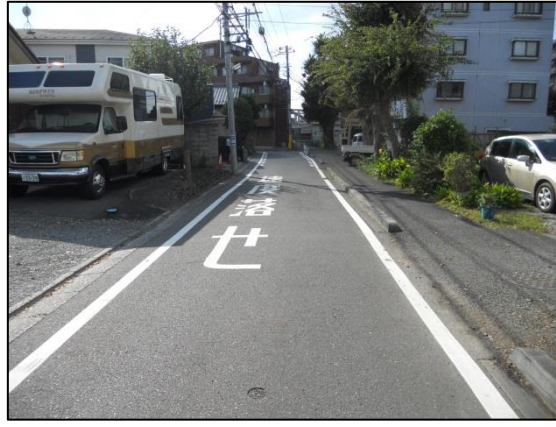
白線の塗りなおし

地区東側の多摩川と川崎街道を結ぶ南北の道路につきましては、時間帯により車両が通行できなくなる交通規制がかかっておりましたが、市民の方から規制を解除できないか市に相談があり、近隣の皆様へのアンケート調査や交通管理者である多摩中央警察署との協議を経て、白線の塗りなおしや看板の整理などの安全施設設置工事を行い、令和元年5月7日に時間規制の解除を行いました。