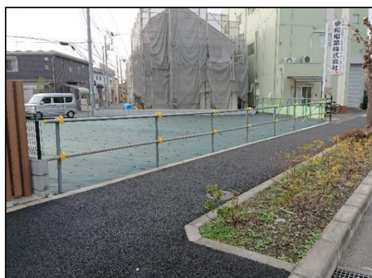
段差が解消した いちよう並木通りの歩道