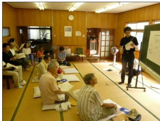
まちづくり懇談会の様子 (平成30年8月5日)

今年度も引き続き、関係する皆様とのお話し合いをさせていただき、換地設計変更案の作成を進めてまいります。