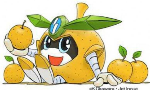
市のイメージキャラクター 「稲城なしのすけ」