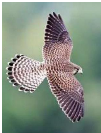
市の鳥 「チョウゲンボウ」