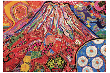
「吉祥富士」 名嘉真照世氏作