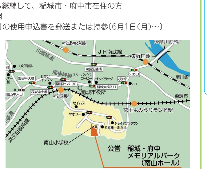
▲メモリアルパーク地図